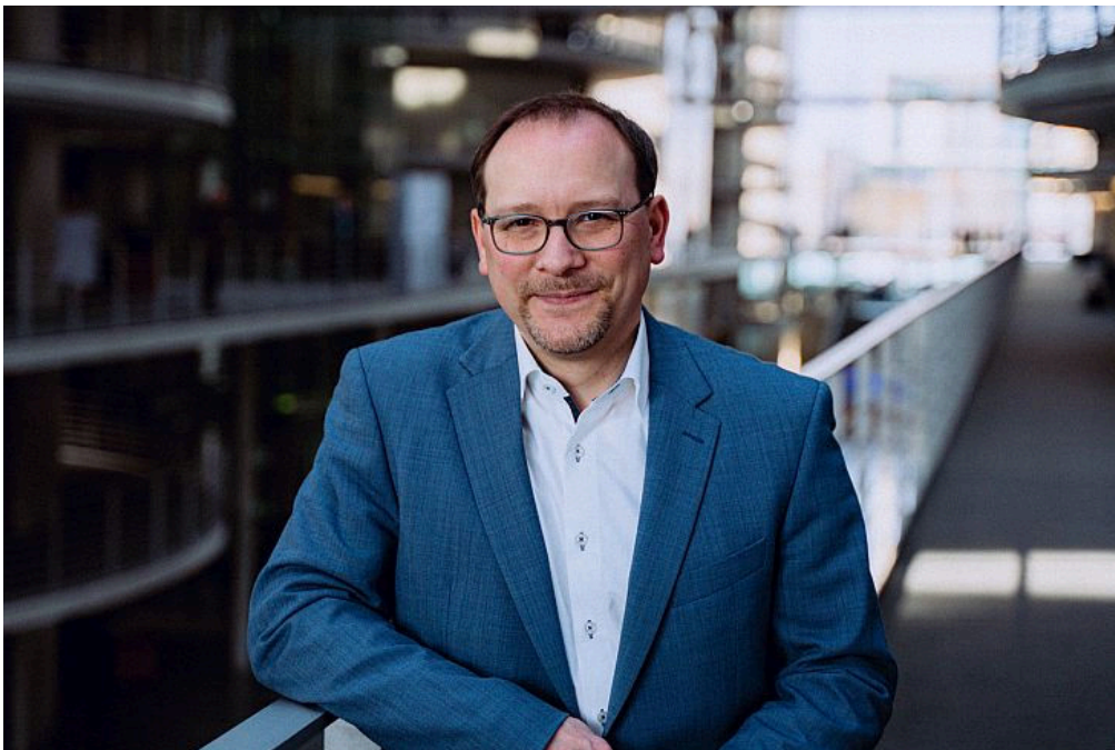
Karsten Klein (MdB)

Die Unterstützung durch den Bund war ein wichtiger Schritt, aber langfristig müssen Länder und Kommunen ihrer Verantwortung gerecht werden, um die stationäre Versorgung zu sichern und zukunftsfähig zu gestalten.