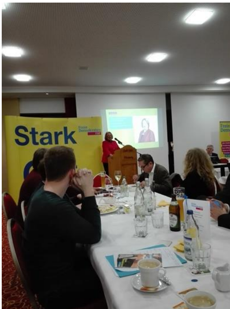
Bundesjustizministerin a.D. und Ehrenvorsitzende der FDP Bayern: Sabine Leutheusser-Schnarrenberger