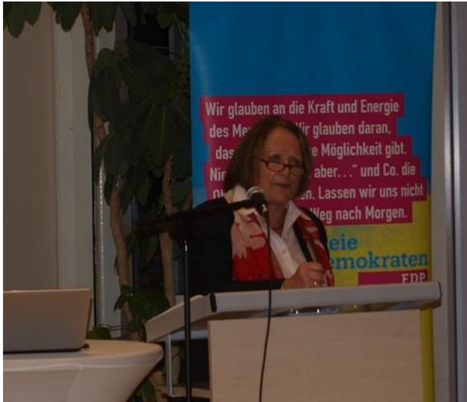
Bundesjustizministerin a.D. und Ehrenvorsitzende der FDP Bayern: Sabine Leutheusser-Schnarrenberger